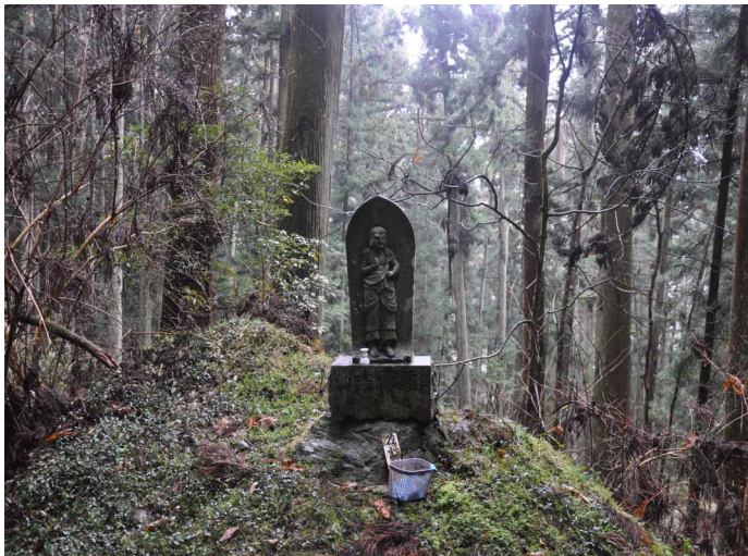
▲ 登山道にある石仏